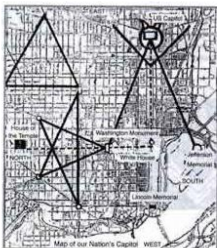
Gambar 9: Denah Monumen Washington

Di samping itu, mereka mempercayai angka-angka. Mereka menafsirkan angka-angka tersebut sebagai bagian dari rencana mereka, sehingga ramalan yang dipikirkannya dapat menjadi kenyataan. Misalnya, mereka meramalkan bahwa pada tanggal 31 Desember 1999 adalah akhir dari segala kejayaan agama-agama di muka bumi, serta bangkitnya Kerajaan Sion untuk memerintah millennium baru yang diawali tahun 2000.